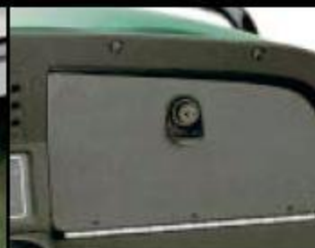
Закрывающееся отделение для перчаток