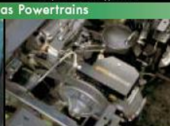
Мощность 11 л.с. 1200G