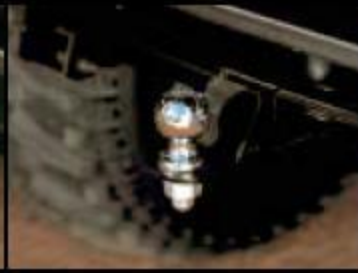
Шарнирная сцепка 1 7/8 дюйма