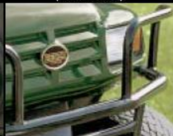
Защита и фары