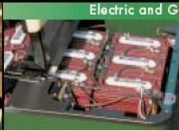
Мощность 48-вольт 1000E