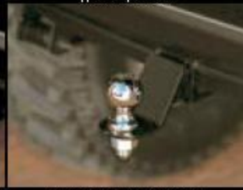
Выносная шарнирная сцепка 1 7/8 дюйма