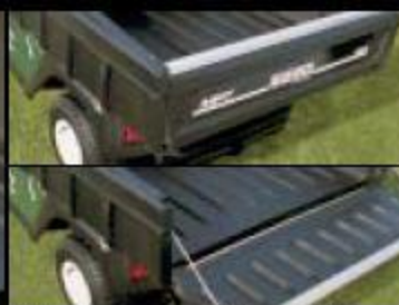
Многопозиционный задний борт (только 1000/1200)