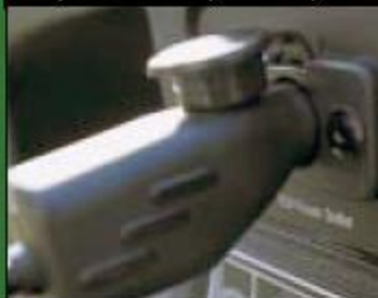
12-вольтовый переходник (только у бензиновых)