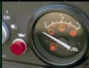
Датчик топлива (только бензиновые)