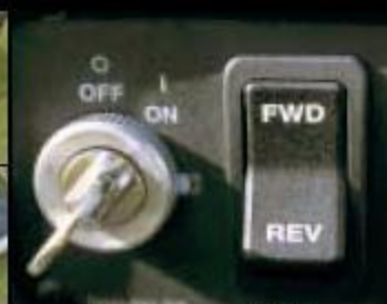
Выключатель FNR ** (только 1000)