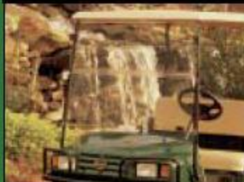
Крыша и ветровое стекло