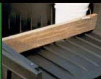
Разделитель кузова (только 1000/120)