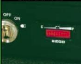
Индикатор зарядки аккумулятора (только электрические)